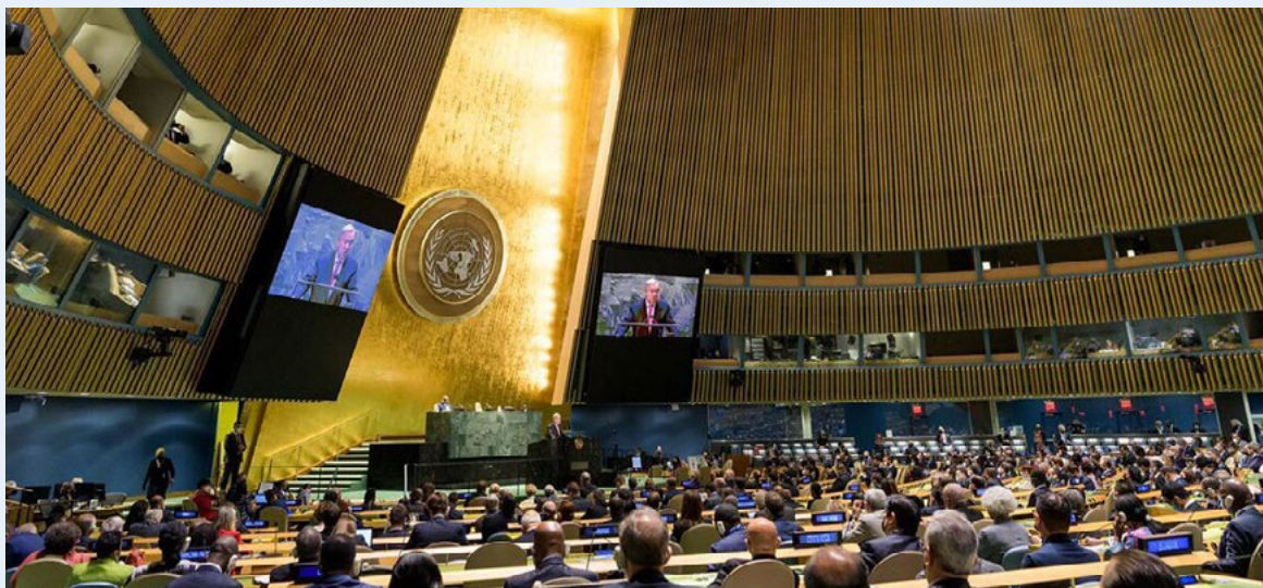
El Secretario General de las Naciones Unidas, António Guterres, dirige el 76 período de sesiones de la Asamblea General en septiembre de 2021.

Los esfuerzos de la CBI por destacar el valor del sector privado en la gestión de desastres aparecieron en varias publicaciones externas en 2021.